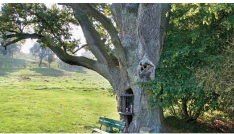
2 Bildchen Altrier