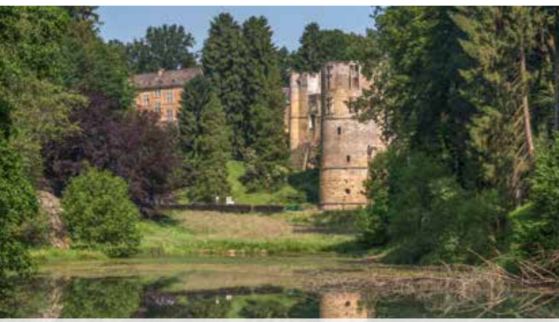
3 Burg & Schloss Beaufort