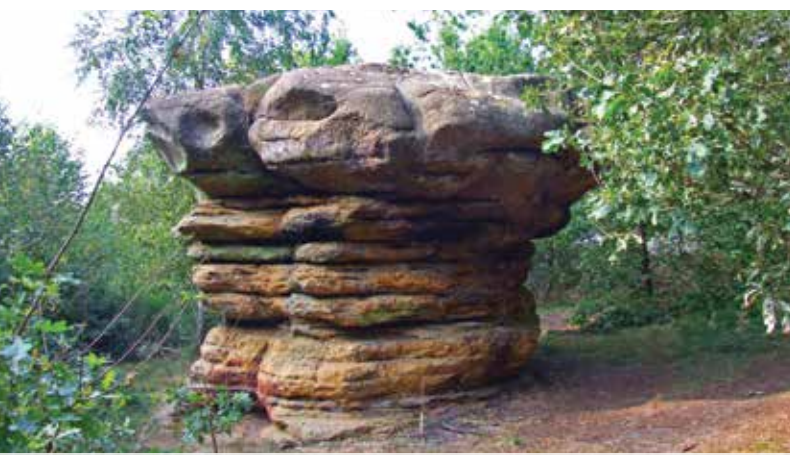
5 Champignon Nommern