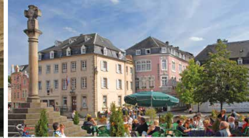
11 Marktplatz Echternach