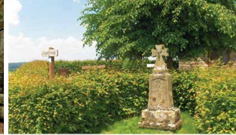
9 Héikräiz Heffingen