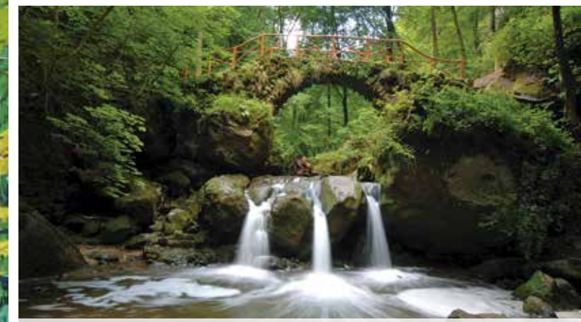
14 Schéissendémpel Müllerthal