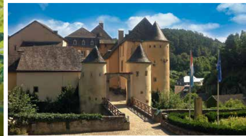
15 Schloss Bourglinster