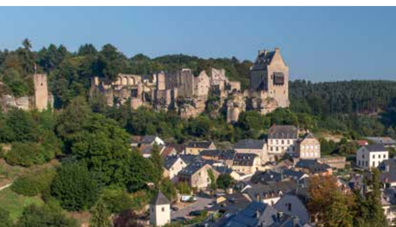
4 Burg Larochette