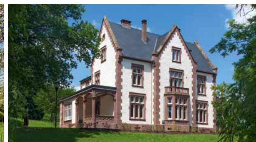
16 Tudormuseum Rosport