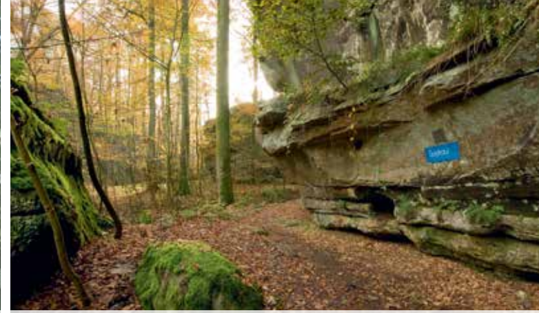
8 Goldkaul Consdorf